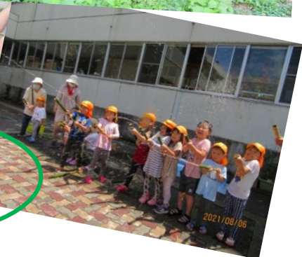
里山こども園 竹で水鉄砲作り