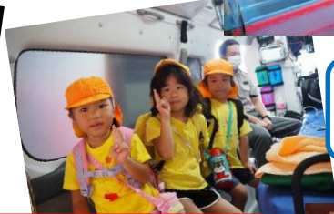
幼児出前講座 ひとりでわけれるもん