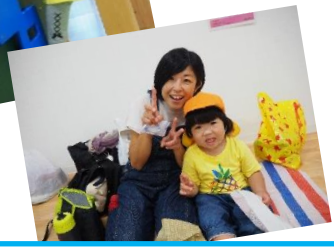
親子バス遠足〜かほっくる〜