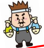
園外保育 ～近江町市場・玉川図書館～