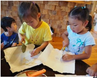
里山こども園 釜炊きご飯体験