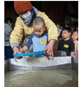
紙すき体験 みずほ保育園との交流