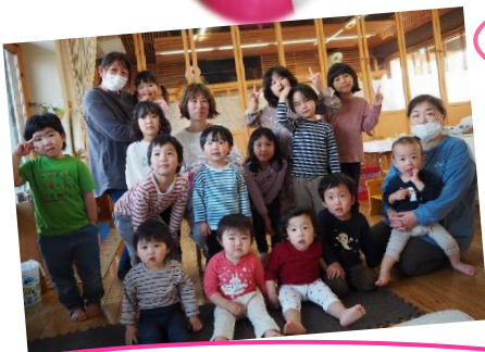
あいさんありがとうございました