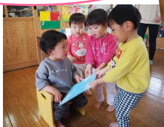
れんちゃんまた遊びにきてね