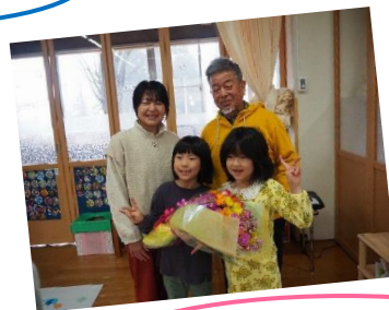
きーさんあっちゃん ありがとうございました