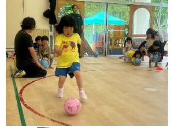
みずほ保育園との交流 サッカー教室