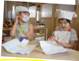
クッキング (クッキー)